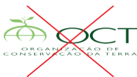
Não distorcer a largura