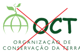
Não mudar a tipografia