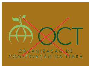
Não aplicar sobre cores que dificultam a leitura da marca