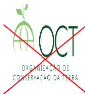
Não distorcer a altura