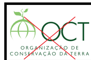
Não aplicar molduras