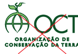
Não aplicar contornos