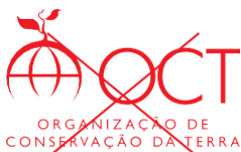
Não mudar a cor