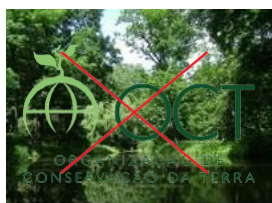
Não aplicar sobre imagens que comprometem a leitura da marca