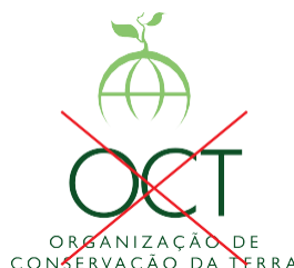
Não desalinhar os elementos