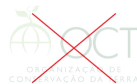
Não alterar a opacidade

A marca não pode ser modificada de forma indevida. Proporções, espaçamentos, formas e cores devem seguir as especificações deste manual.