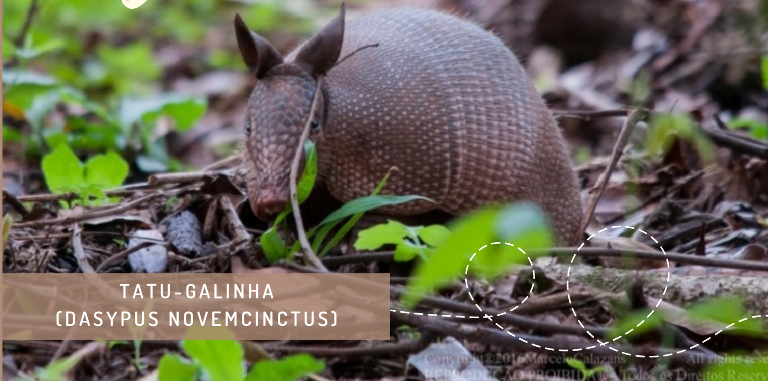
TATU-GALINHA (DASYPUS NOVEMCINCTUS)

Copyright © 2016 Marcelo Calazans. All rights reserved. REPRODUÇÃO PROIBIDA. Todos os Direitos Reservados.