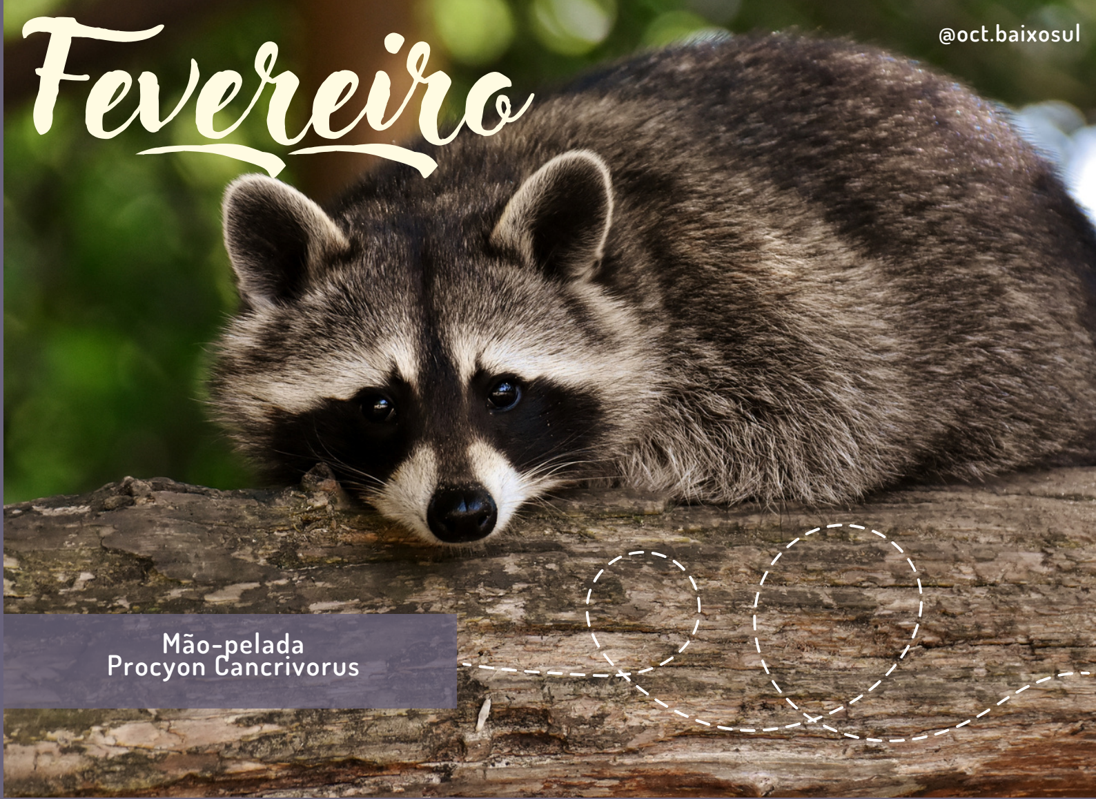
Mão-pelada Procyon Cancrivorus