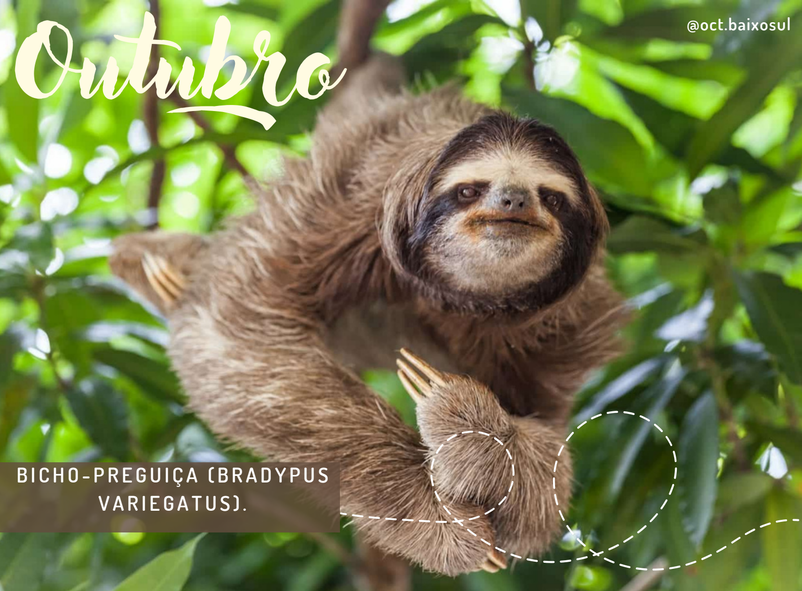
BICHO-PREGUIÇA (BRADYPUS VARIEGATUS).