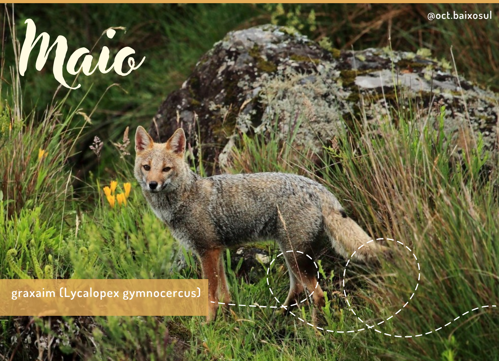
graxaim ( Lycalopex gymnocercus )