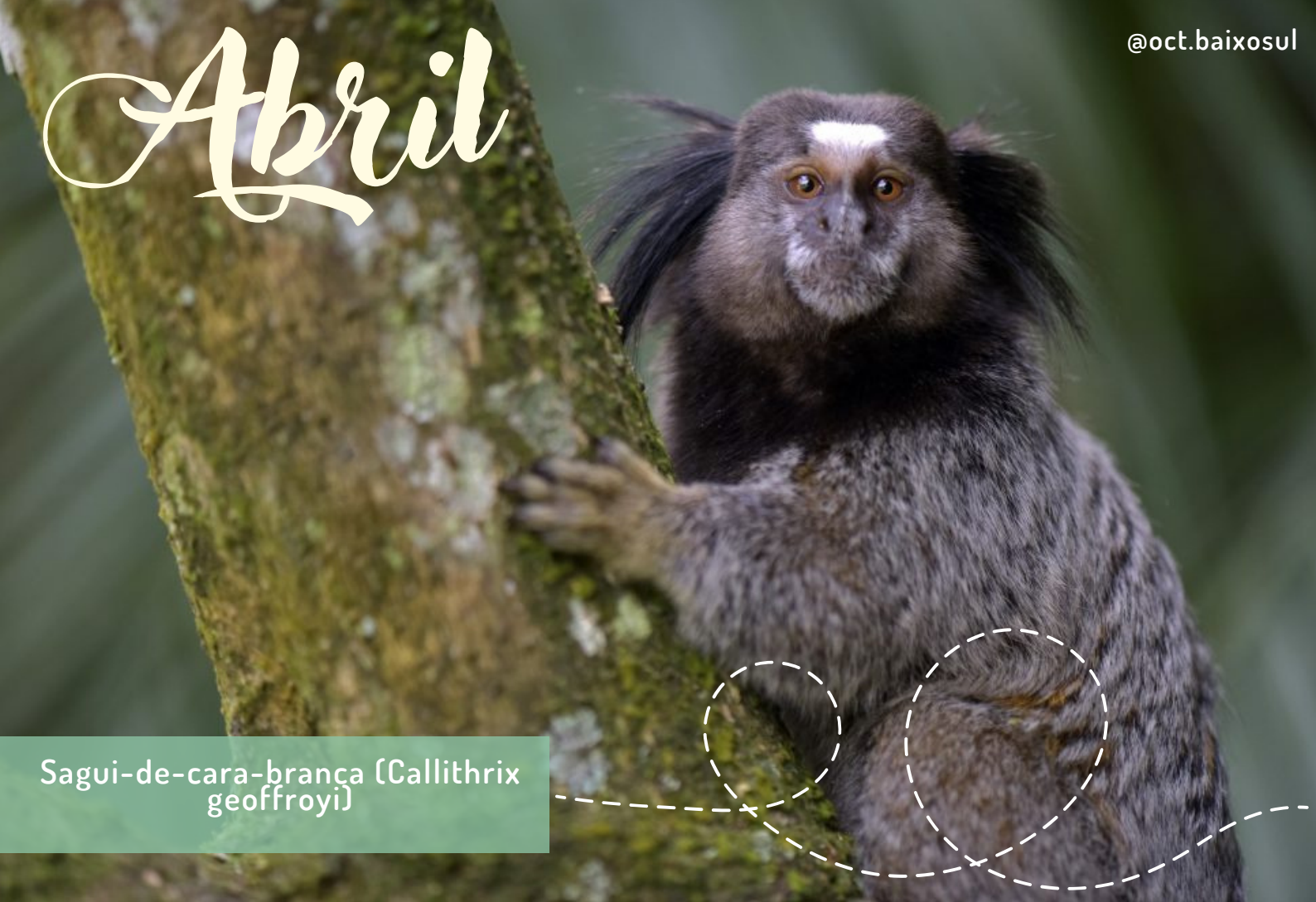
Sagui-de-cara-branca (Callithrix geoffroyi)