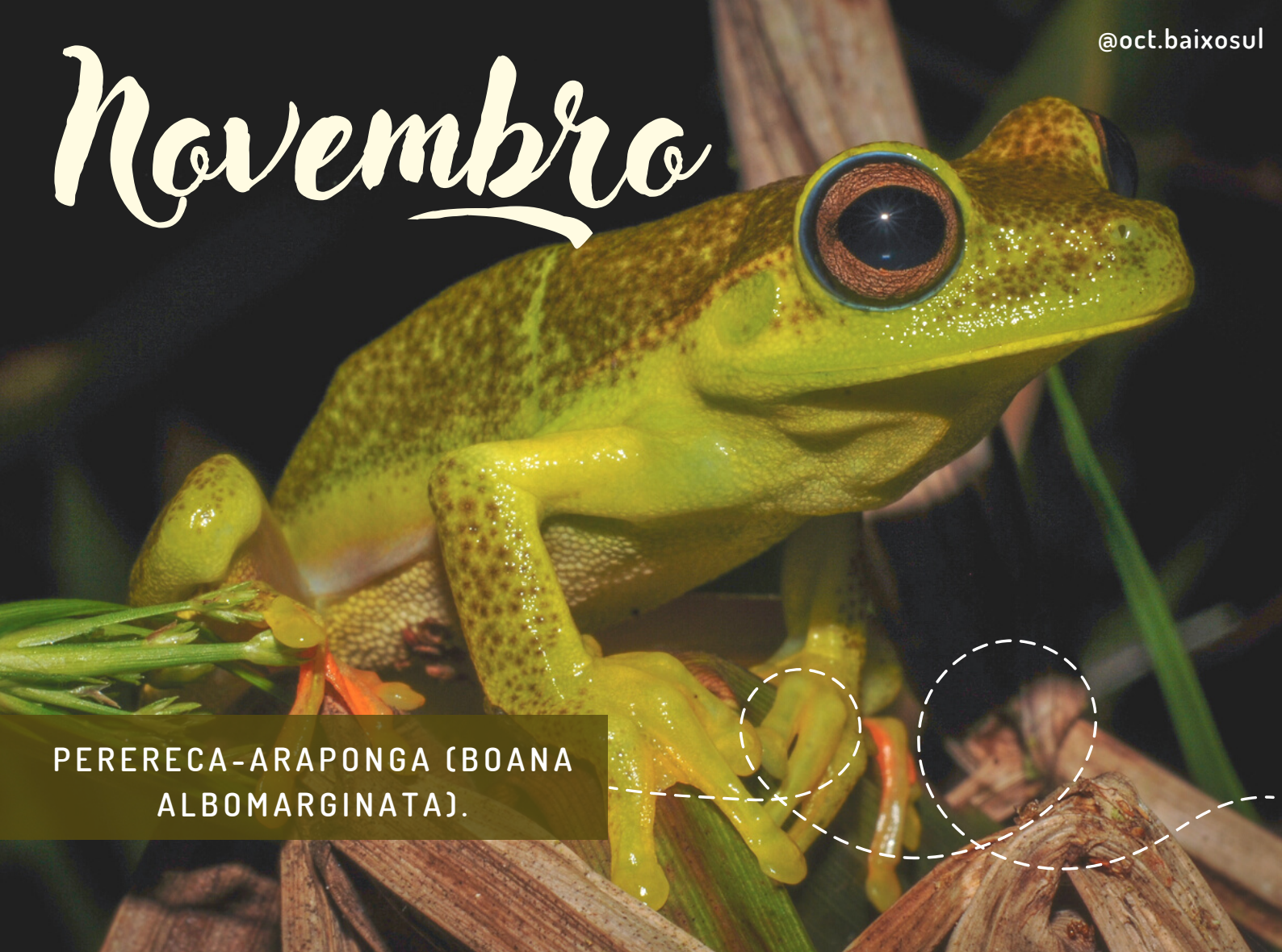
PERERECA-ARAPONGA (BOANA ALBOMARGINATA).