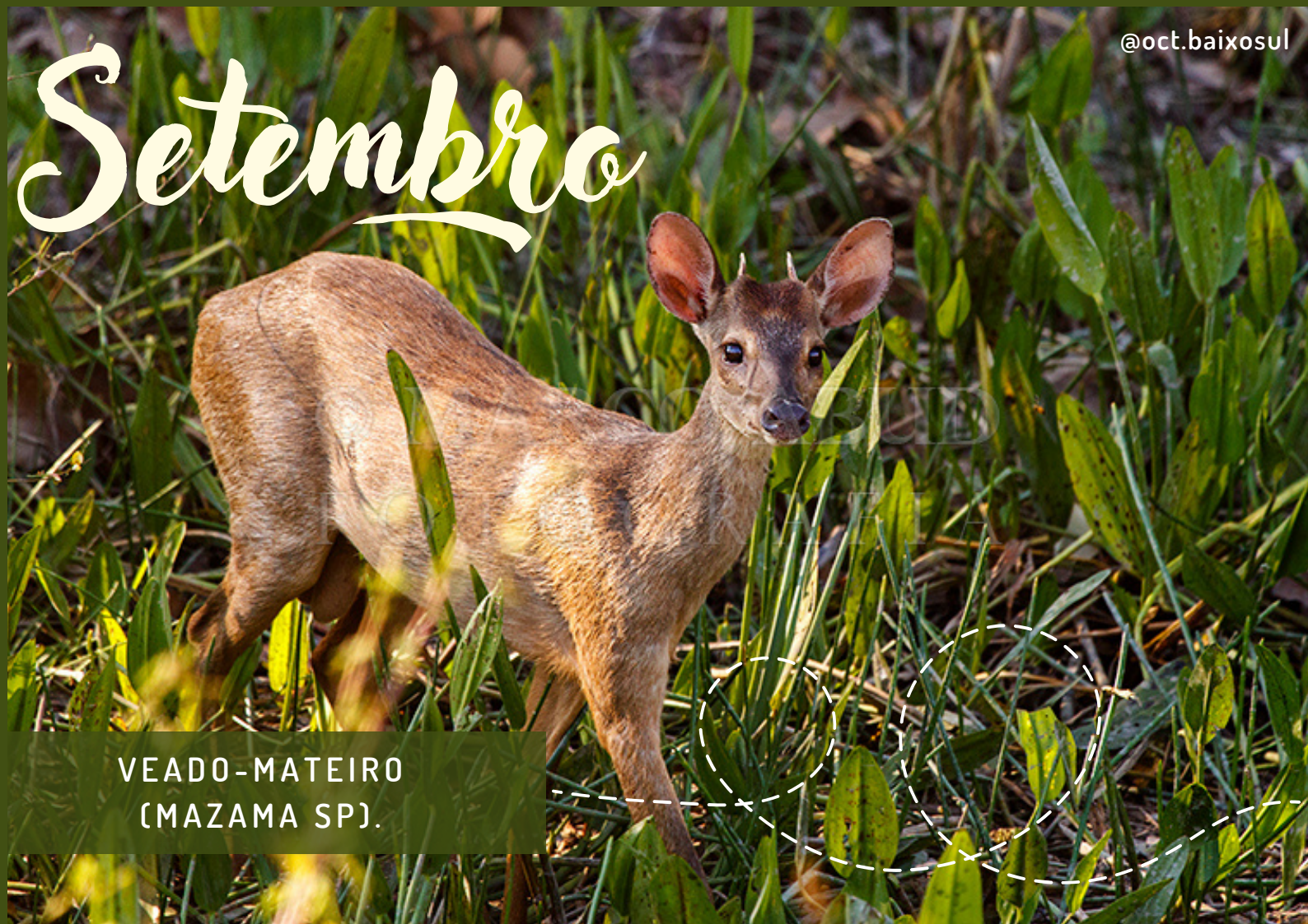
VEADO-MATEIRO (MAZAMA SP).