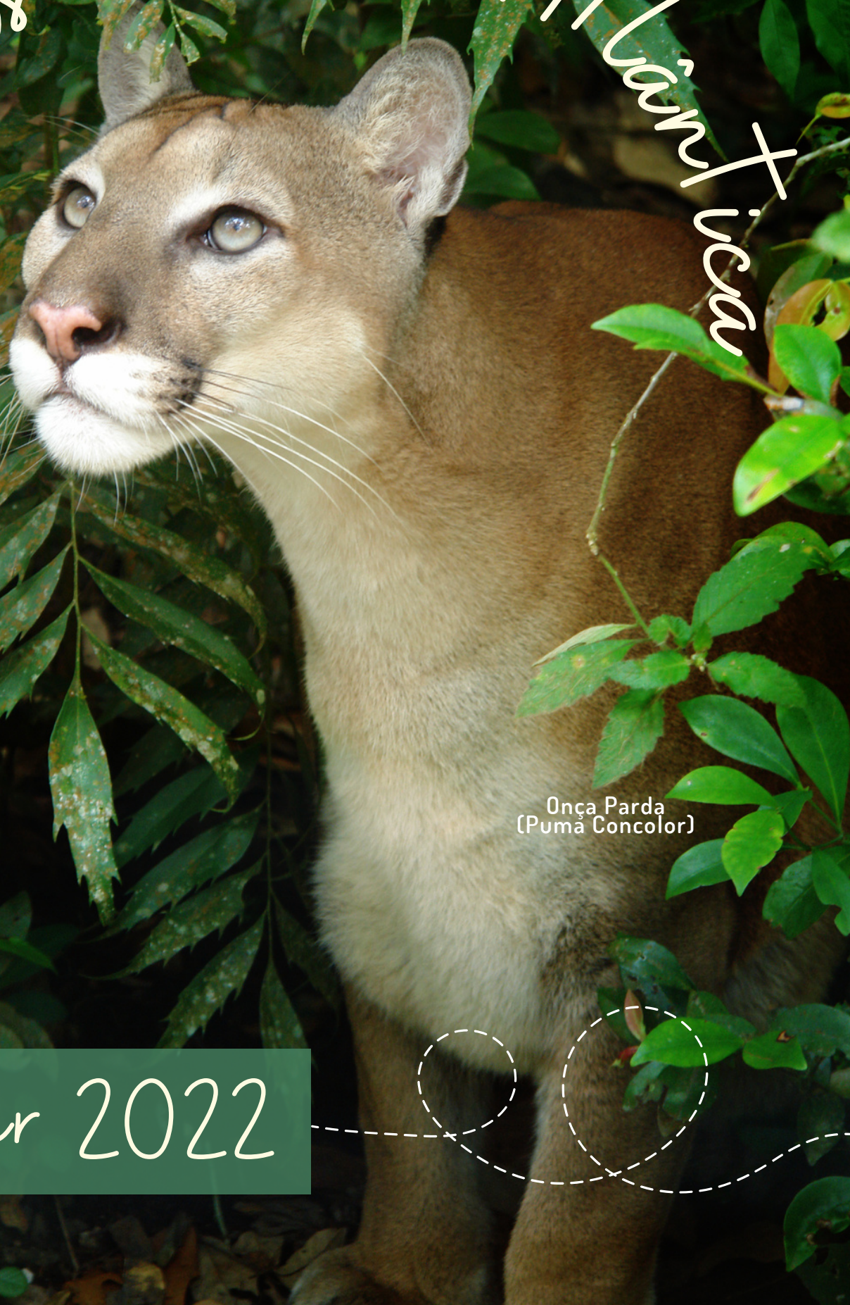
Onça Parda (Pumã Concolor)