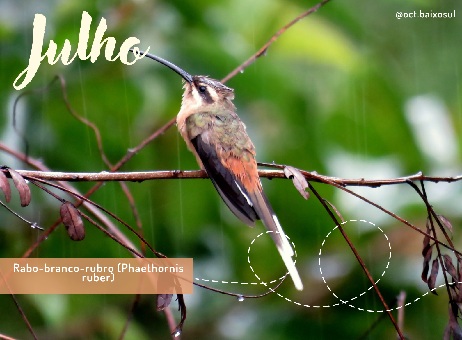
Rabo-branco-rubro (Phaethornis ruber)