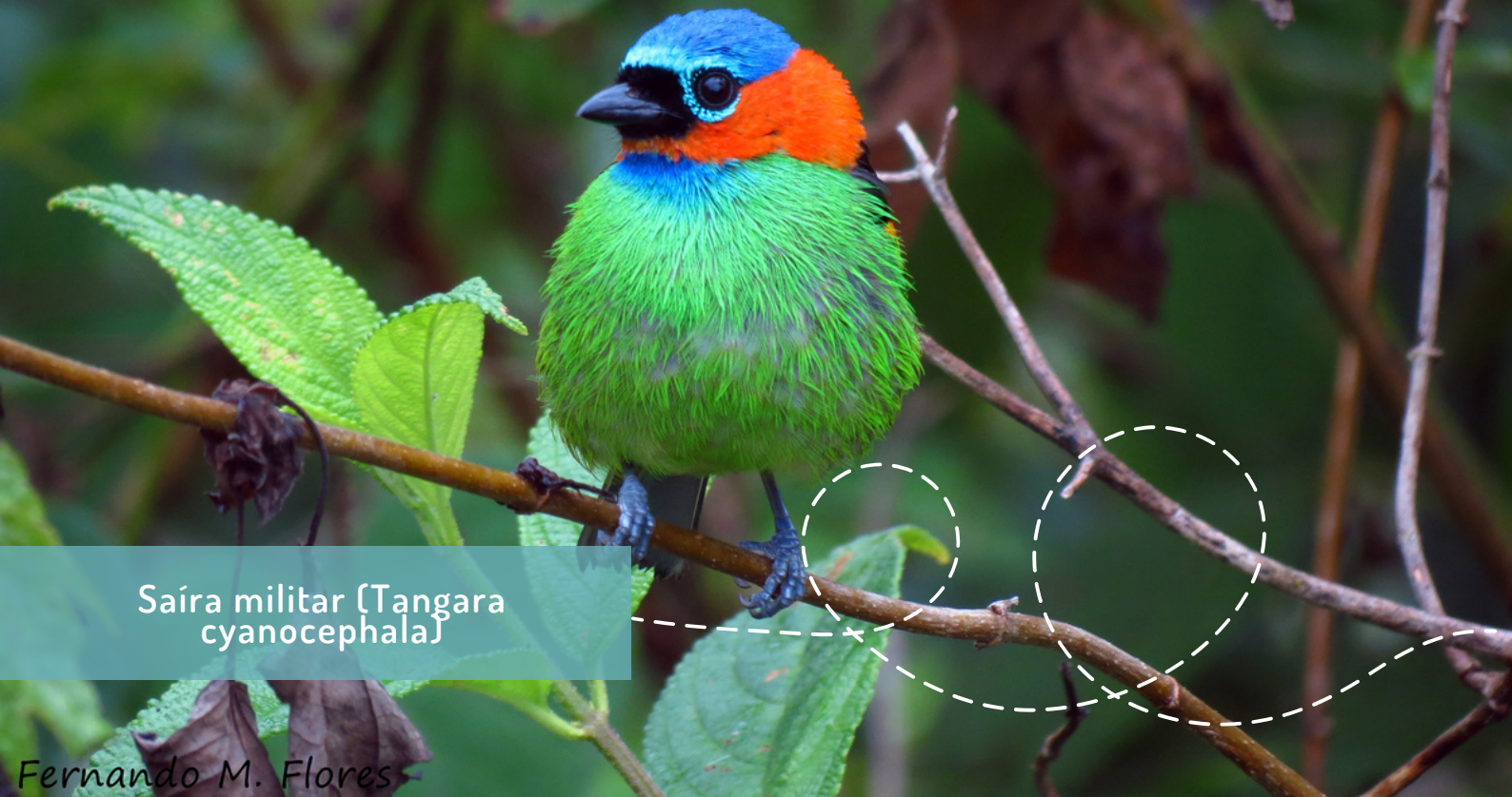
Saíra militar (Tangara cyanocephala)