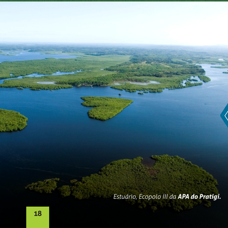
Estuário, Ecopolo III da APA do Pratigi.