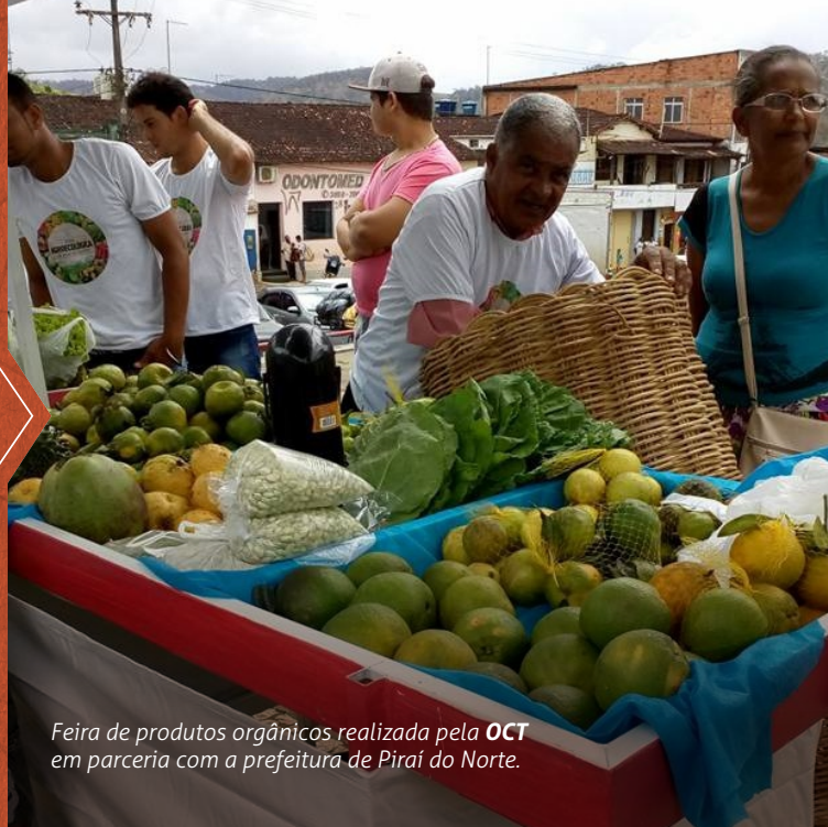
Feira de produtos orgânicos realizada pela OCT em parceria com a prefeitura de Pirai do Norte.

Graças à parceria da instituição com a Rede Povos da Mata, os produtores beneficiados tem acesso à novos mercados, que valorizam e agregam valor aos produtos da agricultura familiar.