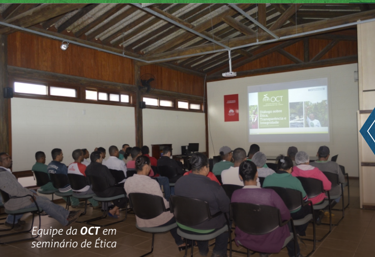
Equipe da OCT em seminário de Ética