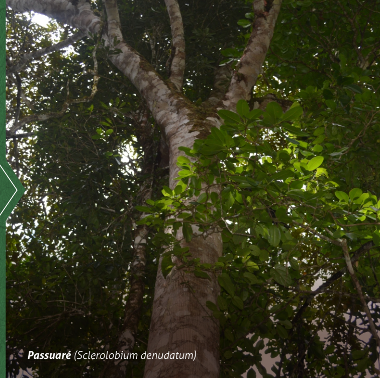
Passuaré (Sclerolobium denudatum)

Através do Carbono Neutro Pratigi, ação que estimula pessoas físicas e jurídicas a neutralizarem suas emissões de Gases de Efeito Estufa, a OCT colabora para a mitigação das mudanças climáticas.