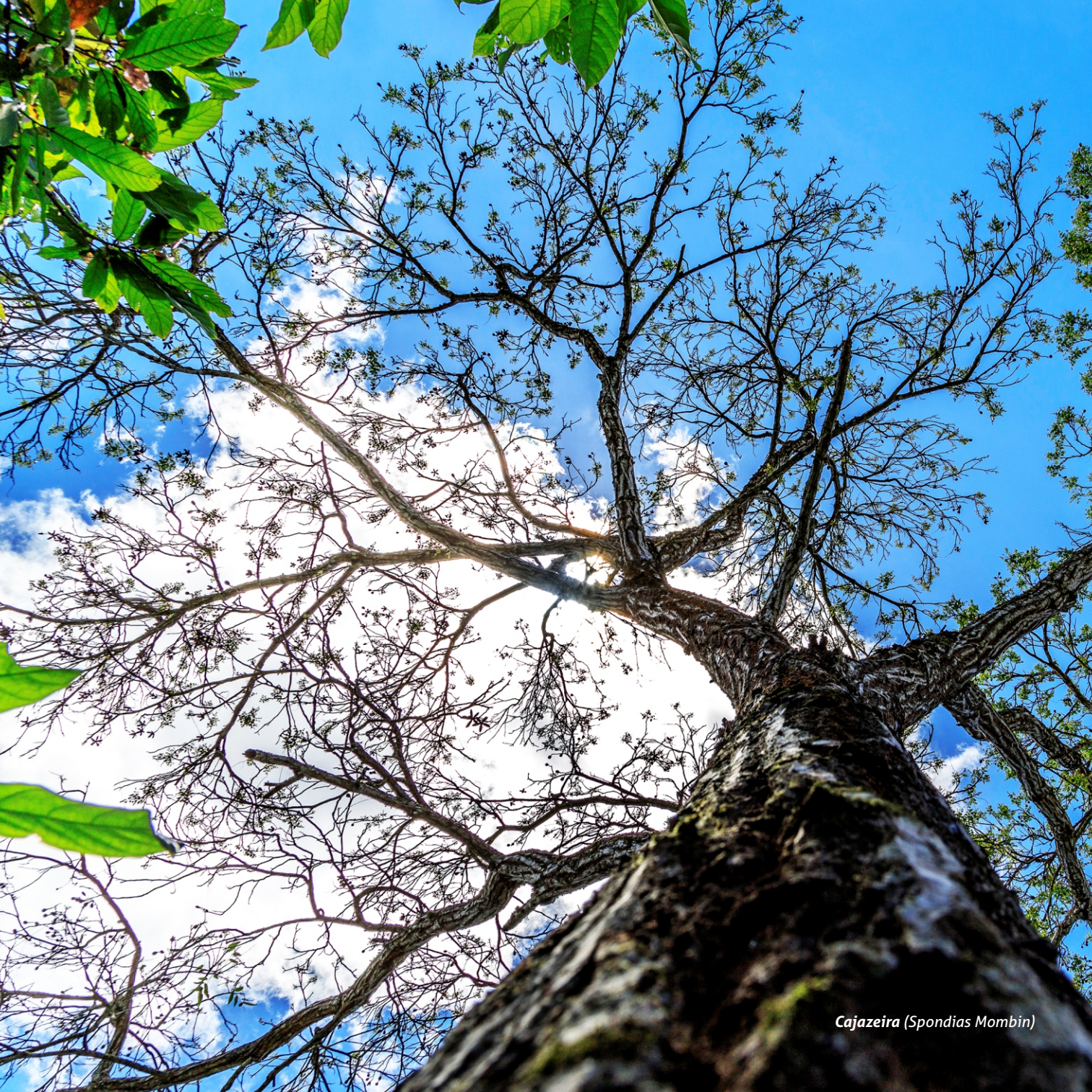
Cajazeira (Spondias Mombin)