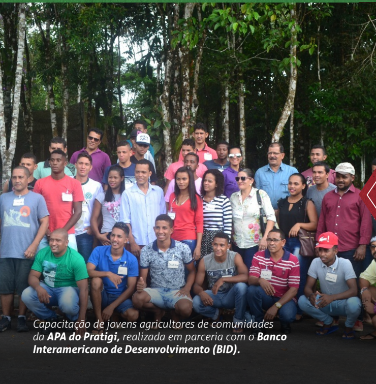
Capacitação de jovens agricultores de comunidades da APA do Pratigi, realizada em parceria com o Banco Interamericano de Desenvolvimento (BID).