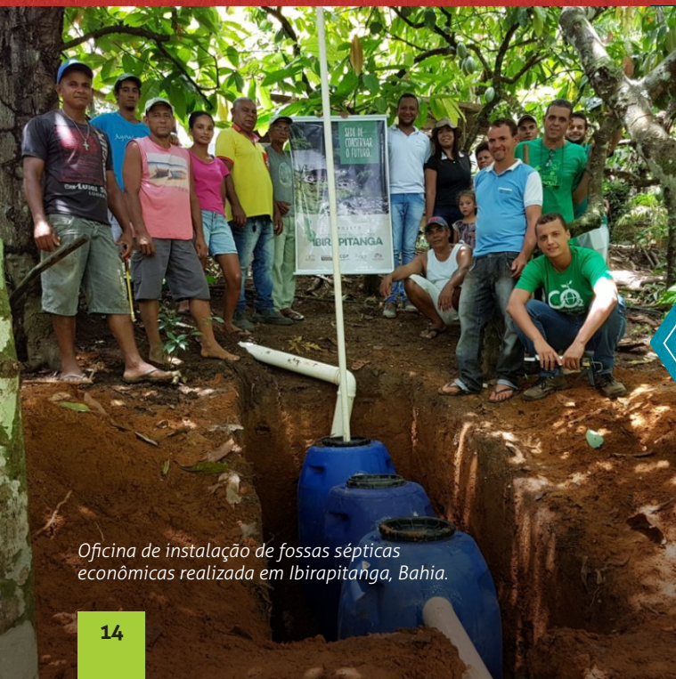
Oficina de instalação de fossas sépticas econômicas realizada em Ibirapitanga, Bahia.