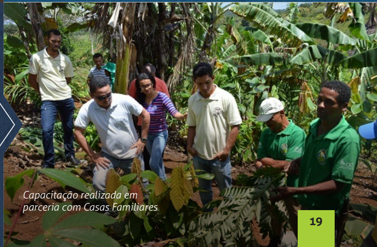
Capacitação realizada em parceria com Casas Familiares

Com o propósito de fortalecer o desenvolvimento em bases conservacionistas a OCT firma parcerias públicas e privadas com diversos atores, que estão em consonância com seus princípios de sustentabilidade.